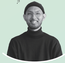
デザイン:米須清成 designer: Kiyonari Komesu

みんなの表現を デザインで伝える。 それがぼくの表現。 Convey everyone's expressions through design. That's my expression.