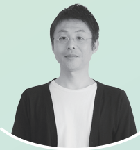
作家:城下浩伺 artist: Koji Shiroshita

一緒にカタチにしていくこと。 それがぼくにできること。 Give shape to your image together. That's what I can do.