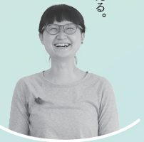
翻訳:松嶋友紀 translator: Yuki Matsushima

日本語と英語のあいだで考える。 それがわたしにできること。 Think somewhere between Japanese and English. That's what I can do.